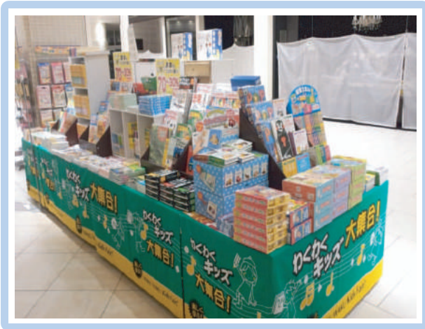
■わくわくキッズ催事